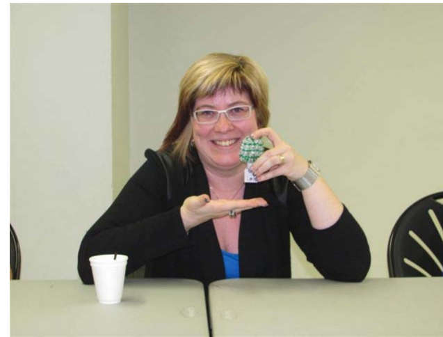
La fée des veilleuses

Belle réussite de la soirée organisée par le comité féminin en collaboration avec les fermières de Saint-Émile le 18 novembre dernier. Tout près de 30 personnes y assistaient et étaient heureuses de leur participation. Merci aux fermières pour leur disponibilité.