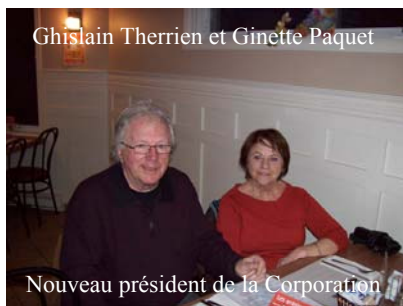
Nouveau président de la Corporation