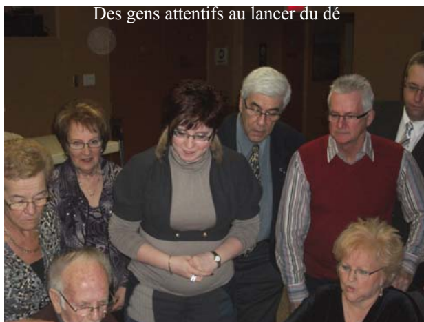
Des gens attentifs au lancer du dé

Le comité est inscrit à Loto-Québec et notre numéro est le 603346. Si vous achetez LOTOMATIQUE simplement mentionner ce numéro et le Comité recevra des commissions sur les achats et aussi les gains. Ça pourrait rapporter beaucoup au Comité et à vous.