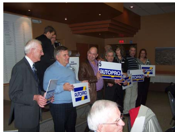
Une partie des finalistes du souper bénéfice 2008